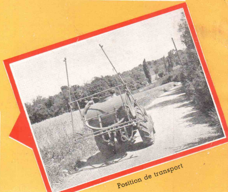
Position de transport

La rampe, composée de 3 éléments, peut être repliée vers le haut en position de transport, les deux éléments extérieurs étant immobilisés dans cette position. La largeur hors-tout de la rampe est alors inférieure à celle du tracteur